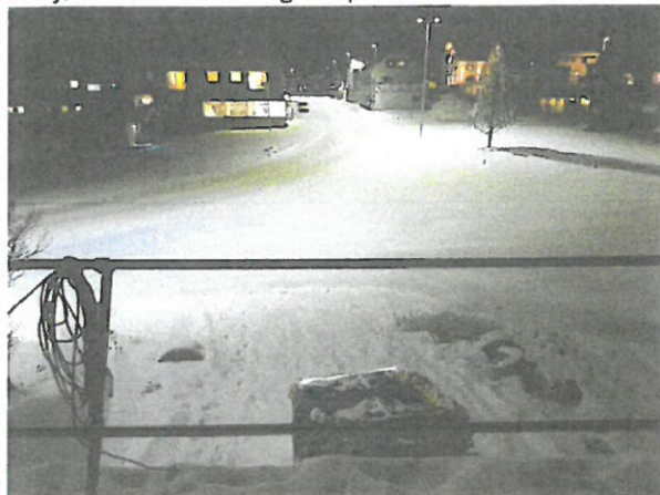
Afkjørsel fra "Berlevåg Utopia Cafe"