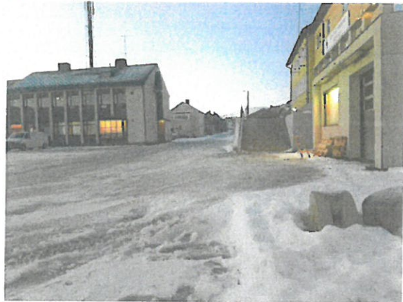
Sikt til høyre