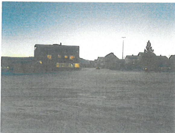
Sikt ret frem