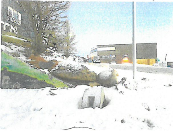
Sikt til venstre (Ligger stenene i veien er de flytbare)