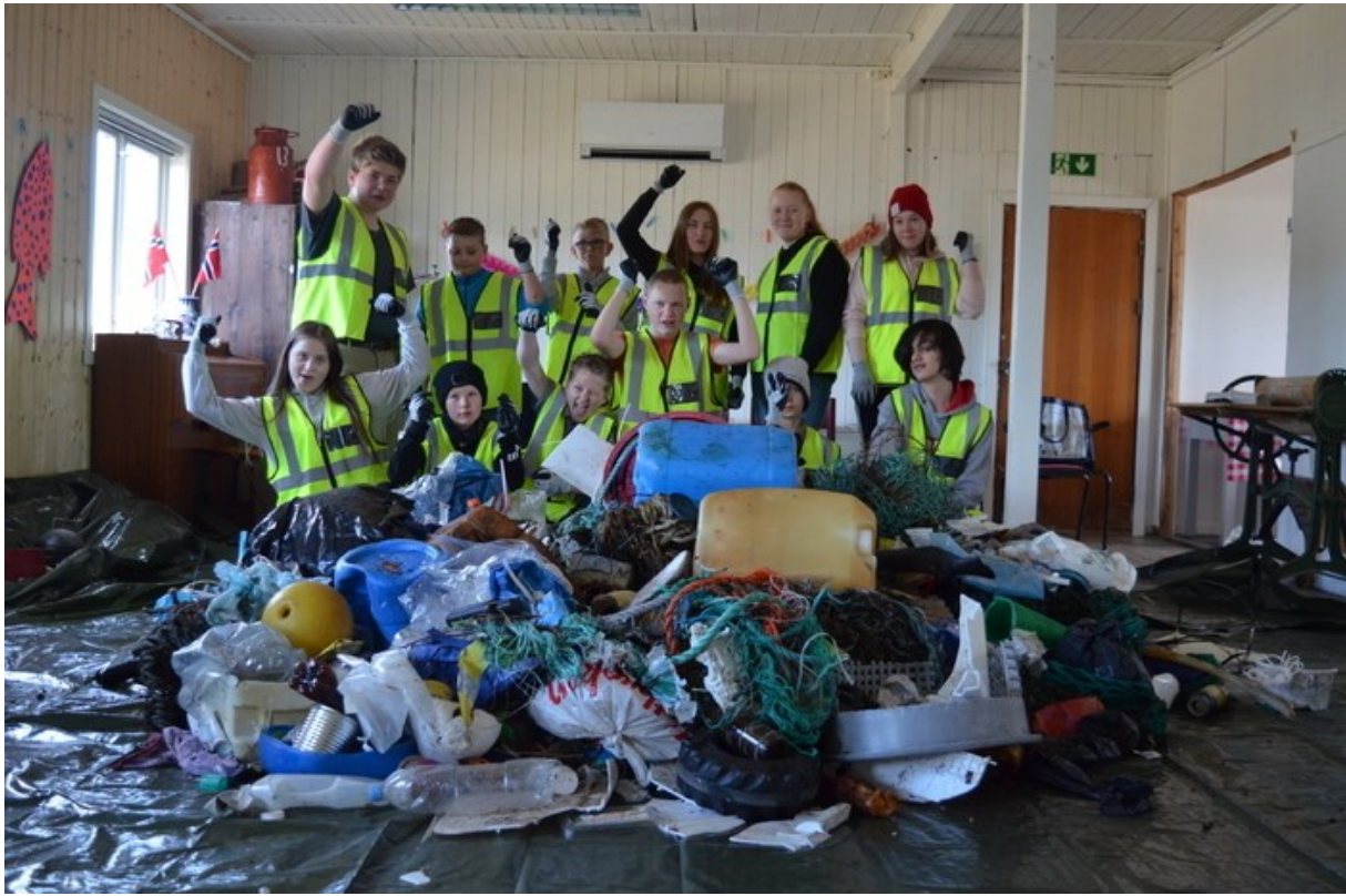
1 En liten del av alt søppelet vi tok med tilbake fra Gulgo fjord.

Etter å ha tatt med søppelet tilbake til Berlevåg sorterte elevene dette etter type som: Fiskeriavfall, byggeavfall, husholdningsavfall og plastposer. I løpet av den kommende uken ble deler av avfallet brukt til å lage Plastkveita som står på utstilling utenfor Kvitbrakka ved Berlevåg Havnemuseum. Elevene deltok også på byggingen av plastkveita.