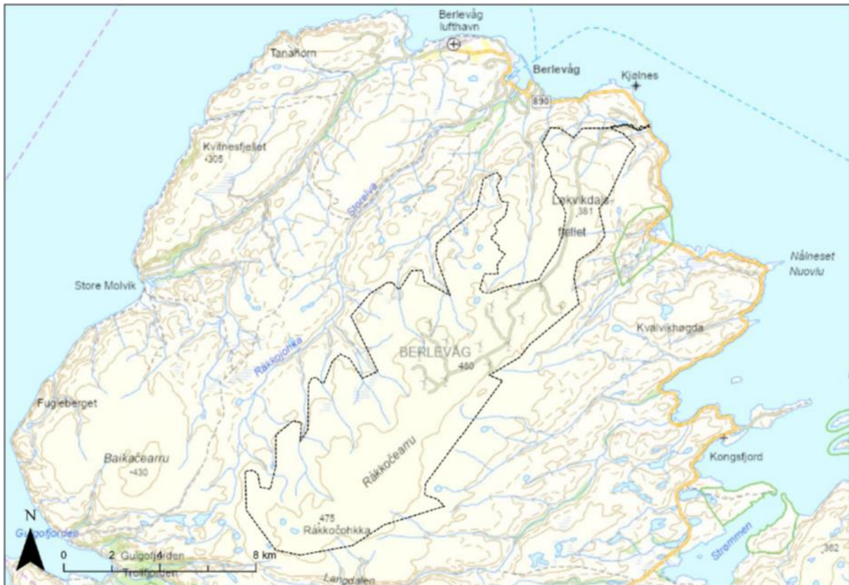
Figur 1: Foreløpig planavgrensning.

Formelt oppstartsmøte for planarbeidet, jf. plan- og bygningslovens § 12-8, ble gjennomført den 11.04.2024.